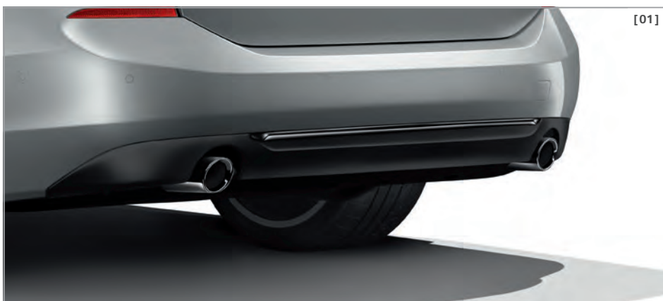
[01] Abbildung oben zeigt 630d Sport Line in der optionalen Außenfarbe Glaciersilber metallic und exklusiven optionalen 20" Leichtmetallräder V-Speiche 686