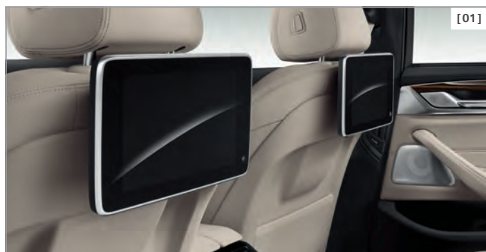
[01] Fond-Entertainment Professional