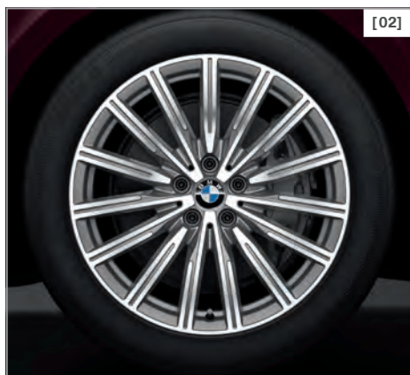
Abbildung oben zeigt 640i xDrive, Luxury Line in der optionalen Außenfarbe Royal Burgundy Red Brillanteffekt metallic und optionale 20" Leichtmetallräder W-Speiche 646, hochglanzpoliert