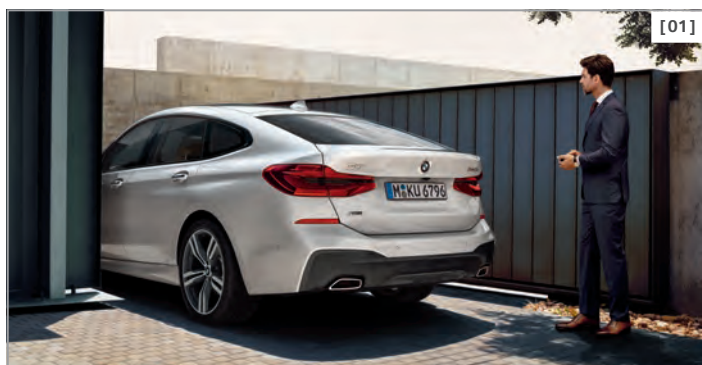
[01] Ferngesteuertes Parken